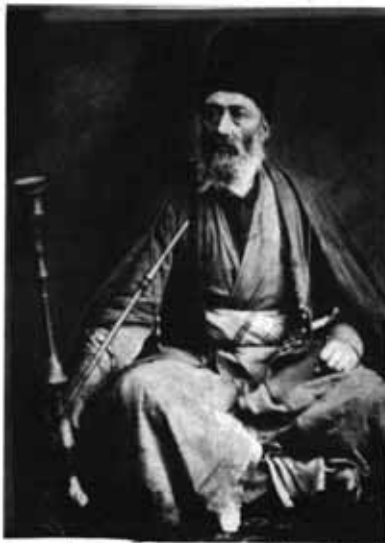
پوشش مردان یهودی در همدان مربوط به سال ۱۸۸۵ میلادی

سال‌های بعدی صرفاً دوره‌ای بوده، بستگی به حاکمان یا فرمانروایان محلی داشته است. حکام سلجوقی که دلبستگی زیادی به تسنن داشتند، جو غیرقابل تحملی را حتی برای شیعیان فراهم آورده بودند. در سال ۱۰۸۵ م. طی حکومت جلال‌الدین ملک‌شاه، قوانین عمر یکبار دیگر به مرحله اجرا درآمد و در سال ۱۰۹۱ م. وی دستور داد تا زنان کلیمی علاوه بر تکه پارچه مشخص شده، باید کفش‌های لنگه به لنگه و غیرهم‌رنگ بپوشند. اشعار فوق‌الذکر و بسیاری دیگر از این دست در آن دوره، بیانگر رواج کاربرد تکه پارچه زردرنگ در آن زنان می‌باشد.