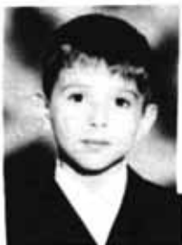
شاگرد بنجم ابتدایی کلاس پنجم ابتدایی