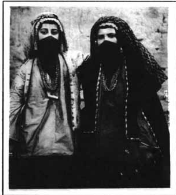
پوشش زنان کرد یهودی ایران مربوط به سال‌های ۱۹۰۰-۱۸۱۰ میلادی

به طور کلی، جامه اصلی مردان در اواخر قرن نوزدهم میلادی شامل پیراهنی بود بی‌یقه و بی‌سر و آستین به نام پیراهن، شلوار و بالاپوشی به نام قبا. شلوار تا چند اینچ بالاتر از قوزک پا می‌آمد و در ناحیه کمر با بندی که در جلو گره می‌خورد، بسته می‌شد. مردان حکومتی شلوارهایی باریک و بلند می‌پوشیدند. روی شلوار بالاپوشی سه‌ربعی با یقه هفت به نام قبا پوشیده می‌شد که تا نزدیکی زانوهای می‌رسید (هر چه وضعیت اقتصادی ضعیف‌تر بود، طول این بالاپوش کوتاه‌تر می‌شد). این بالاپوش چاک‌هایی برای سهولت حرکت در طرفین داشت، همراه با آستین‌هایی بلند یا کوتاه. قبا را با یک شال به دور کمر می‌بستند. بهترین نوع این شال از جنس پشم لطیف کشمیر بود. در مورد افراد کم بضاعت تکه پارچه‌ای بلند و باریک و حتی یک طناب نقش شال را ایفا می‌کرد. کت یا نیم‌تنه‌ای آستین‌دار و رنگی با جیب‌هایی بر آن به نام «آرخالق» اغلب زیر قبا پوشیده می‌شد. بسته به فصل سال یا توان مالی فرد، مردان بر روی همه اینها بالاپوشی به نام «کلیجه» که در پشت