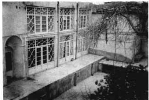
نمای خارجی کنیسا عزرا یعقوب محله کلیمیان تهران، عودلاجان

انجمن کلیمیان تهران در مشورت با میراث فرهنگی تهران اقدام به بازسازی و تکمیل بنای کنیسا عزرایعقوب در مرکز محله سنتی کلیمیان تهران (سرچال) در ناحیه عودلاجان نموده است. این کنیسا که تاریخ بنای آن به حدود دویست سال می‌رسد با سبک خاص معماری کنیساهای شرقی بنا شده و دارای دو سالن کنیسا در طرفین حیاط بزرگ و یک محل ساخت سوکا در ایام موعده سوکا (عید سایانها) و یک تنور مصاپزی کوچک و یک میقوه (محل غسل شرعی) بوده است که متأسفانه بیشتر قسمت‌های آن به صورت مخروبه درآمده بود و بخشی از محوطه کنیسا به وسیله مجاورین تصرف شده بود.