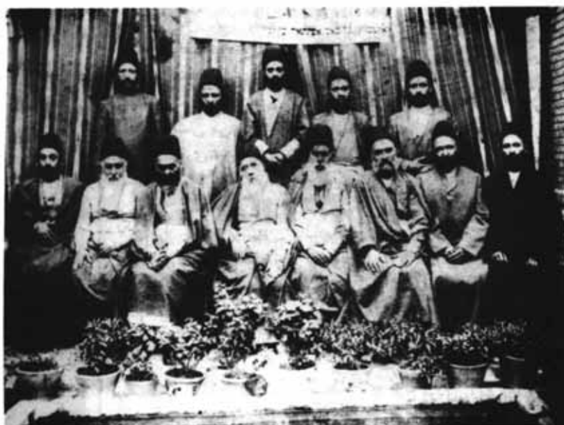
اعضای هیئت مدیره انجمن کلیمیان و حبراء در سال ۱۲۷۷ شمسی با لباس‌های روز خود

در سال ۱۹۲۸ م. اندک زمانی پس از سلطنت رضا شاه (دوره حکومت: ۱۹۲۵-۱۹۴۱ م.) نامبرده تمامی مردان را به پوشیدن کت و شلوار اروپایی و کلاهی شبیه «کپی» فرانسوی که در ایران به آن کلاه پهلوی می‌گفتند، مکلف ساخت. او همچنین در سال ۱۹۳۶ م. پوشیدن چادر و روسری را برای زنان قدغن کرد. این قانون در آغاز با مقاومت مواجه شد، حتی از سوی زنان یهودی، اما سرانجام با زور و اجبار، فرمان شاه غالب آمد و بالاخره هر نوع تمایز در پوشاک، کاملاً منسوخ گردید. ■