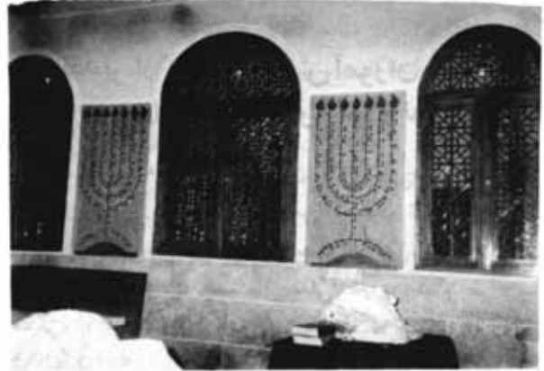
مخال، محل نگهداری تومارهای مقدس تورات، کنیسا عزرایعقوب

انجمن کلیمیان تهران در مشورت با میراث فرهنگی تهران اقدام به بازسازی و تکمیل بنای کنیسا عزرایعقوب در مرکز محله سنتی کلیمیان تهران (سرچال) در ناحیه عودلاجان نموده است. این کنیسا که تاریخ بنای آن به حدود دویست سال می‌رسد با سبک خاص معماری کنیساهای شرقی بنا شده و دارای دو سالن کنیسا در طرفین حیاط بزرگ و یک محل ساخت سوکا در ایام موعده سوکا (عید سایانها) و یک تنور مصاپزی کوچک و یک میقوه (محل غسل شرعی) بوده است که متأسفانه بیشتر قسمت‌های آن به صورت مخروبه درآمده بود و بخشی از محوطه کنیسا به وسیله مجاورین تصرف شده بود.