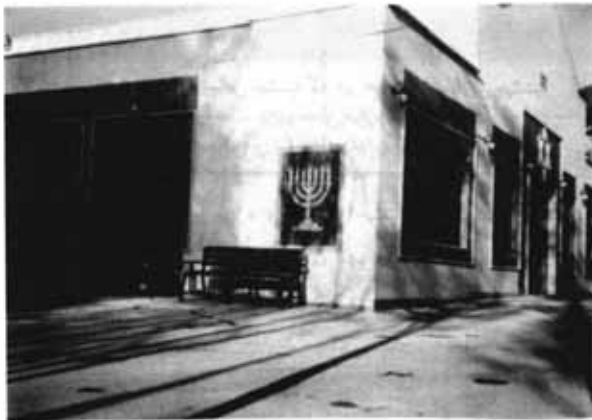
نمای خارجی سالن بهشتیه بعد از بازسازی

سالن اجتماعات بهشتیه تهران واقع در خیابان خراسان ۶۴ سال پیش ساخته شده بود و در طی این مدت طولانی فرسودگی ساختمان و مشکلات دیگر، این سالن بزرگ را به حالت متروکه و غیرقابل استفاده درآورده بود. اخیراً هیئت مدیره انجمن کلیمیان تهران تصمیم به نوسازی و مرمت سالن بهشتیه گرفت تا این مرکز را به محلی فرهنگی و اجتماعی تبدیل نماید.