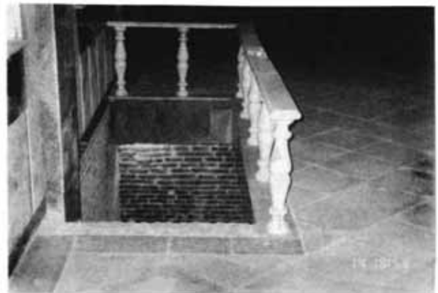
سردابه زیرین در سالن بهشتیه که در جریان بازسازی بهشتیه پیدا شده و در نظر است برای محل موزه سنگ قبرهای قدیمی کلیمیان مورد استفاده قرار گیرد.

هم‌اکنون تعداد کتاب‌های ثبت شده بیشتر از ۱۵ هزار جلد است که توجه اصلی در کتابخانه به جمع‌آوری منابع دینی و