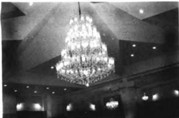
نمای داخلی سالن موزه و اجتماعات بهشتیه بعد از بازسازی

سالن اجتماعات بهشتیه تهران واقع در خیابان خراسان ۶۴ سال پیش ساخته شده بود و در طی این مدت طولانی فرسودگی ساختمان و مشکلات دیگر، این سالن بزرگ را به حالت متروکه و غیرقابل استفاده درآورده بود. اخیراً هیئت مدیره انجمن کلیمیان تهران تصمیم به نوسازی و مرمت سالن بهشتیه گرفت تا این مرکز را به محلی فرهنگی و اجتماعی تبدیل نماید.