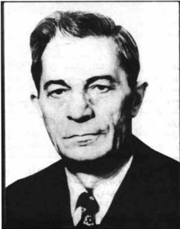
زننه یاد «استاد سلیمان حیییم»

به مناسبت آماده‌سازی فرهنگ فارسی - عبری مرحوم سلیمان حیییم